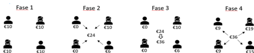
Figura 1. Il gioco dei beni pubblici.

dotazione tenere per sé e quanta invece destinarne al finanziamento di “progetto collettivo”. I contributi raccolti all’interno del gruppo vengono sommati e moltiplicati per una costante (ad esempio 1,5) e divisi in parti uguali tra i membri del gruppo. Un possibile esito del gioco è riportato in figura 1.