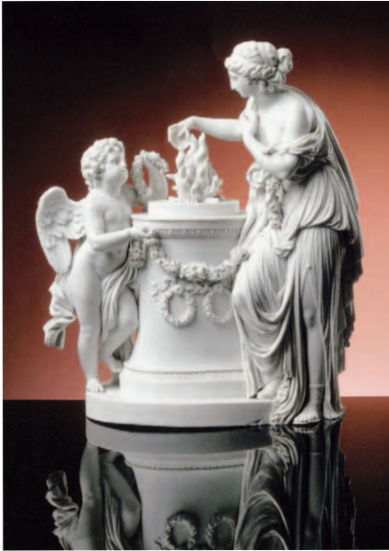
■ 7. Christian Gottfried Jüchtzer, Altare dell'Amicizia , 1783, porcellana di Meissen. Dresda, Staatliche Kunstsammlungen