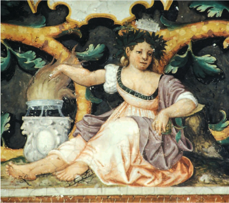
■ 5. Marcello Fogolino e collaboratori, Allegoria dell'Amicizia , 1539-1540, affresco. Cavalese (Trento), Palazzo della Magnifica Comunità, Salone clesiano, parete sud (stato al 1985)

dato inspiegabilmente scomparso. L'immagine riflette con rigorosa acutezza la personificazione allegorica codificata da Cesare Ripa nell' Iconologia 11 :