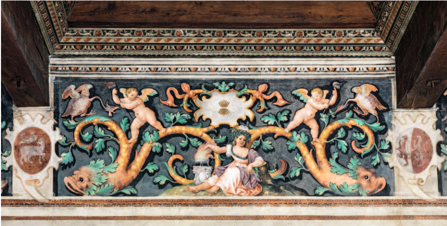
■ 4. Marcello Fogolino e collaboratori, Allegoria dell'Amicizia , 1539-1540, affresco. Cavalese (Trento), Palazzo della Magnifica Comunità, Salone clesiano, parete sud (stato odierno)

a piccoli delfini simmetrici con le code allacciate, memori dell'ornato quattrocentesco che raffigura il Trono di Nettuno in San Vitale a Ravenna, tramandato in un'incisione di Marco Dente 9 .