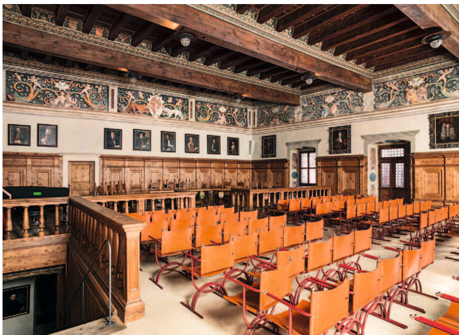
■ 2. Cavalese (Trento), Palazzo della Magnifica Comunità, vista del Salone clesiano.

ambiente che ora custodisce opere dei pittori Nicola Grassi, Giovanni Battista Pittoni e Paul Troger. La sala, con soffitto a travi riccamente intagliate, mostra le pareti dipinte a finto broccato e un fregio in chiaroscuro, animato da cani flessuosi che chiudono la curva decorativa dei girali e putti vivaci che si dondolano sui rami vitinei, a dispetto di ogni legge dell'equilibrio 8 . Il fregio, in cui si scorgono tratti raffaelleschi e citazioni dirette da stampe di Marcantonio Raimondi, reca lo stemma del principe vescovo Cristoforo Madruzzo (1539-1567) e la data dei restauri compiuti nell'anno 1935. In un angolo fu ricostruita la scala lignea a chiocciola che saliva all'appartamento vescovile.