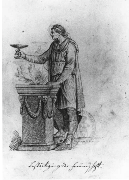
■ 8. Johann Esaias Nilson, Sigillo dell'Amicizia , 1783, disegno. Monaco di Baviera, Zentralinstitut für Kunstgeschichte, Abbildungs-Sammlung des Reallexikons zur Deutschen Kunstgeschichte

Alla voce Fede nell'amicitia , Ripa tratteggia una figura femminile con la mano destra protesa e coperta da un velo