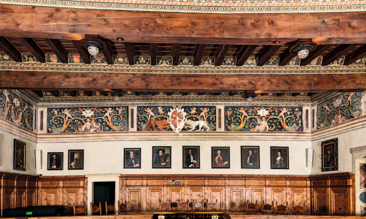
■ 13. Cavalese (Trento), Palazzo della Magnifica Comunità: Salone clesiano, fregio della parete ovest

questa data, nel formulare associazioni rigide tra deduzioni di motivi iconografici dell'antico e attribuzioni di significati allegorici.