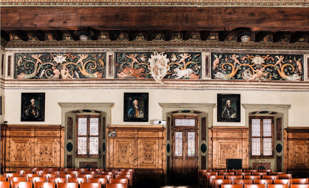
■ 21. Cavalese (Trento), Palazzo della Magnifica Comunità: Salone clesiano, fregio della parete est

I temi mitologici, allegorici e fantasiosi esternati con notevole intuizione evocativa e liberatoria in tutte le campiture dei fregi si animano portando in scena creature straordinarie, proprie di un mondo irreal e favoloso, capaci di conferire all'insieme il senso dell'incanto e dell'irrazionale, sigillando con eleganza gli ambienti di un palazzo residenziale estivo come quello dei principi vescovi di Trento a Cavalese nel primo Cinquecento. Ivi compaiono torsi semiumani con fibre vegetali filiformi che si staccano dai corpi e teste di galli. Entra in scena il tacchino – all'epoca appena importato in Europa – nei suoi colori grigiastri e con il serpente in bocca, vista la sua particolare abilità di catturare le vipere. Sono immagini di un mondo mitico e leggendario, che dialogano con la flora palpitante di vita multiforme e la forza segreta di creature ibride, talora mostruose, in bilico tra la realtà e la finzione.