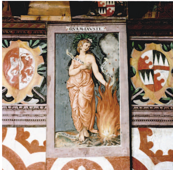
■ 9. Marcello Fogolino e collaboratori, Allegoria dell'Amicizia , 1543, affresco. Cles (Trento), Palazzo assessorile, Sala del Giudizio

nell'età moderna e, più avanti, nel Settecento, anche per integrare il concetto di Fedeltà 18 . Diverse le testimonianze illustrative a noi pervenute: basti citare la raffinata porcellana di Christian Gottfried Jüchtzer dedicata all' Altare dell'Amicizia (1783, fig. 7), che vede una figura muliebre scaldare il cuore sul fuoco dell'ara, di fronte a un amorino 19 . Data al 1783 anche il disegno, in gessetto e penna, eseguito da Johann Esaias Nilson († 1788), noto incisore e miniaturista attivo ad Augsburg, che raffigura il Sigillo dell'Amicizia , interpretato da una figura maschile che alza la coppa sopra le fiamme dell'ara 20 (fig. 8).