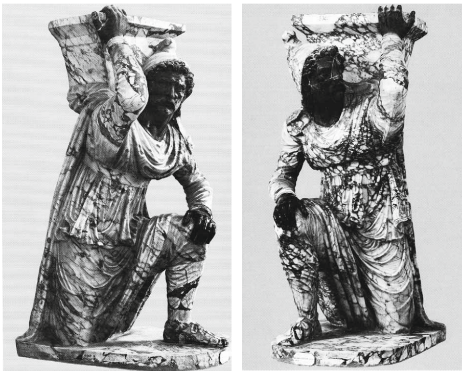
■ 18-19. Barbari orientali , II secolo d.C., marmi. Napoli, Museo Archeologico Nazionale

ghe rinascimentali, nell'opera grafica di artisti come Nicoletto da Modena 49 ; ma anche nelle gustose grottesche della Sala della Cagliostro in Castel Sant'Angelo a Roma, ad opera di Luzio Romano (1545) 50 .