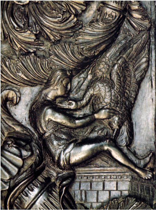
■ 11. Antonio Averlino detto il Filarete, Battente della porta maggiore della Basilica di San Pietro , 1445, bronzo. Città del Vaticano, Basilica di San Pietro (dettaglio con Leda e il cigno )

donne mortali e ninfe, quindi, alla leggenda di Leda; la quale era nota anche per la Costellazione del Cigno , grazie ai manuali di mitologia astrale di Iginio (I-II sec. d. C) – De Astronomia / Poeticon Astronomicon stampati a Venezia nel 1485 – e ai Mitografi medievali, nonché alla Genealogia deorum gentilium di Giovanni Boccaccio 29 .