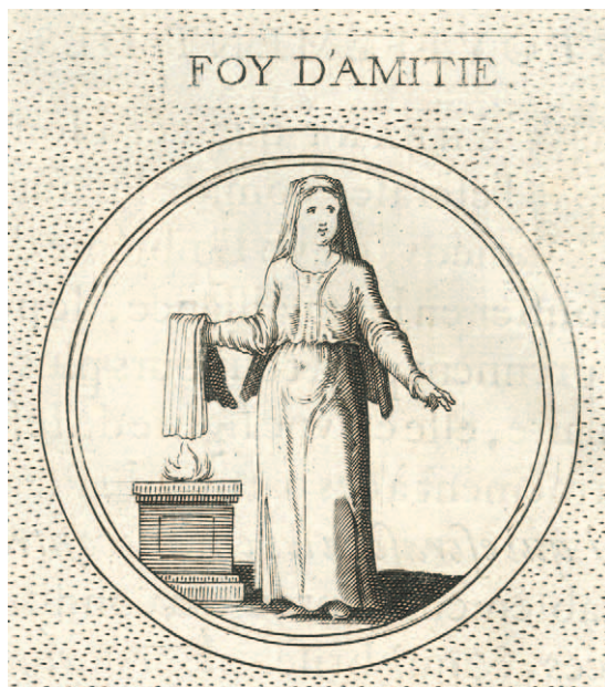
■ 6. Jacques de Bie, Allegoria della Foy d'amitié , 1644, incisione. Da: Iconologie, ou, explication nouvelle de plusieurs images , Paris, 1644

cizia con un carattere proprio del culto per la Dea Fides 15 , promuovendo altresì il concetto della Fede nell'Amicitia . L'immagine della giovinetta con la mano sul fuoco è un motivo evocato da Ripa nell' Iconologia a partire dal 1593 e illustrato, per la prima volta, a corredo dell'allegoria foy d'amitié nell'edizione francese dell' Iconologia di Cesare Ripa a cura di Jean Baudoin nel 1644 (fig. 6):