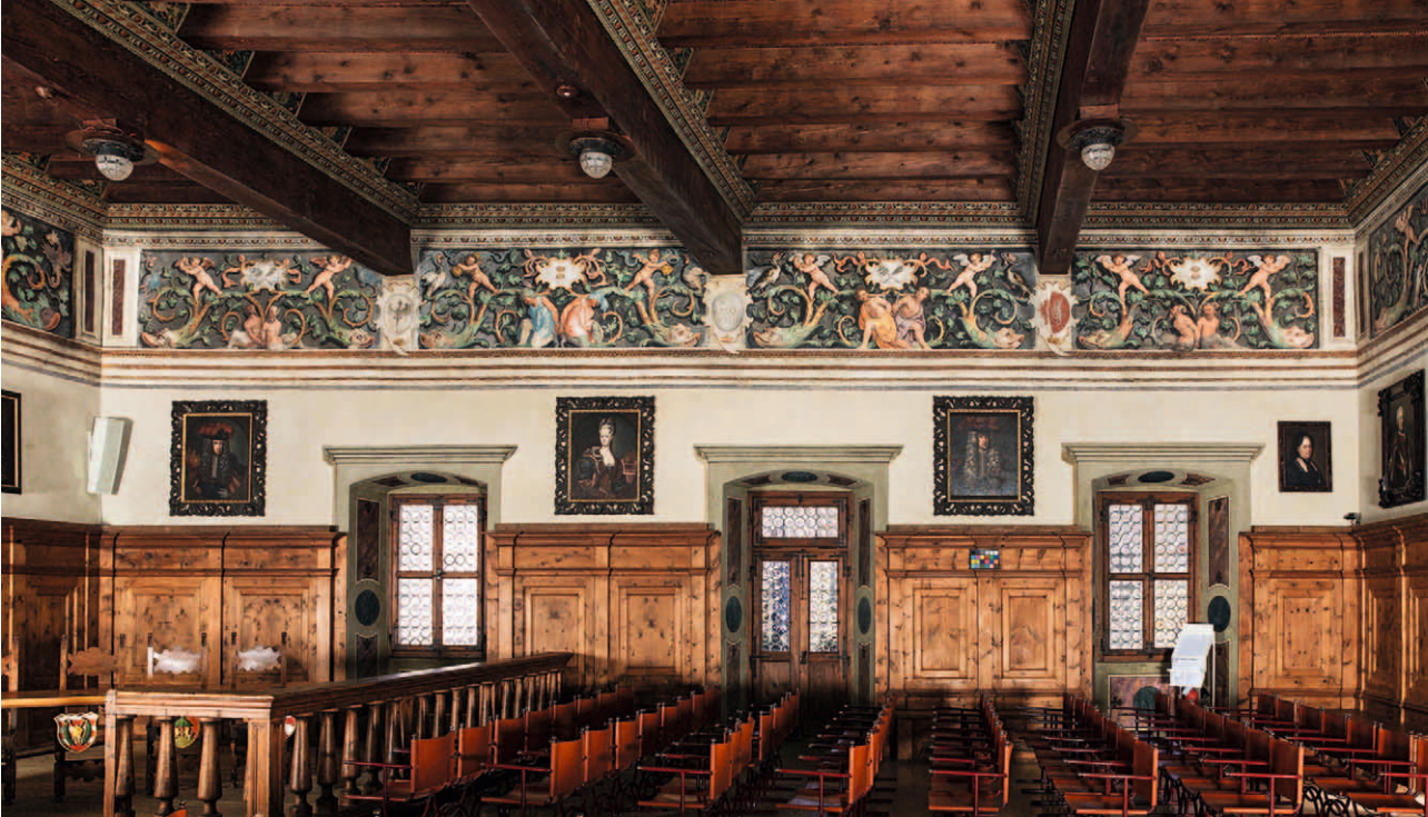
■ 16. Cavalese (Trento), Palazzo della Magnifica Comunità: Salone clesiano, fregio della parete nord

preso di spalle. I due personaggi abbigliati all'orientale (fig. 17) presentano consonanze, nella tipologia e nello stile, con lo schiavo in posa inginocchiata che s'incontra in un fregio della Sala del Giudizio nel Palazzo assessorile di Cles, opera dello stesso cantiere 44 . Nei due dipinti a grottesca, a Cavalese e a Cles, queste figure portano analoghi e vistosi turbanti, vestono allo stesso modo e sono ritratte nella medesima posa.