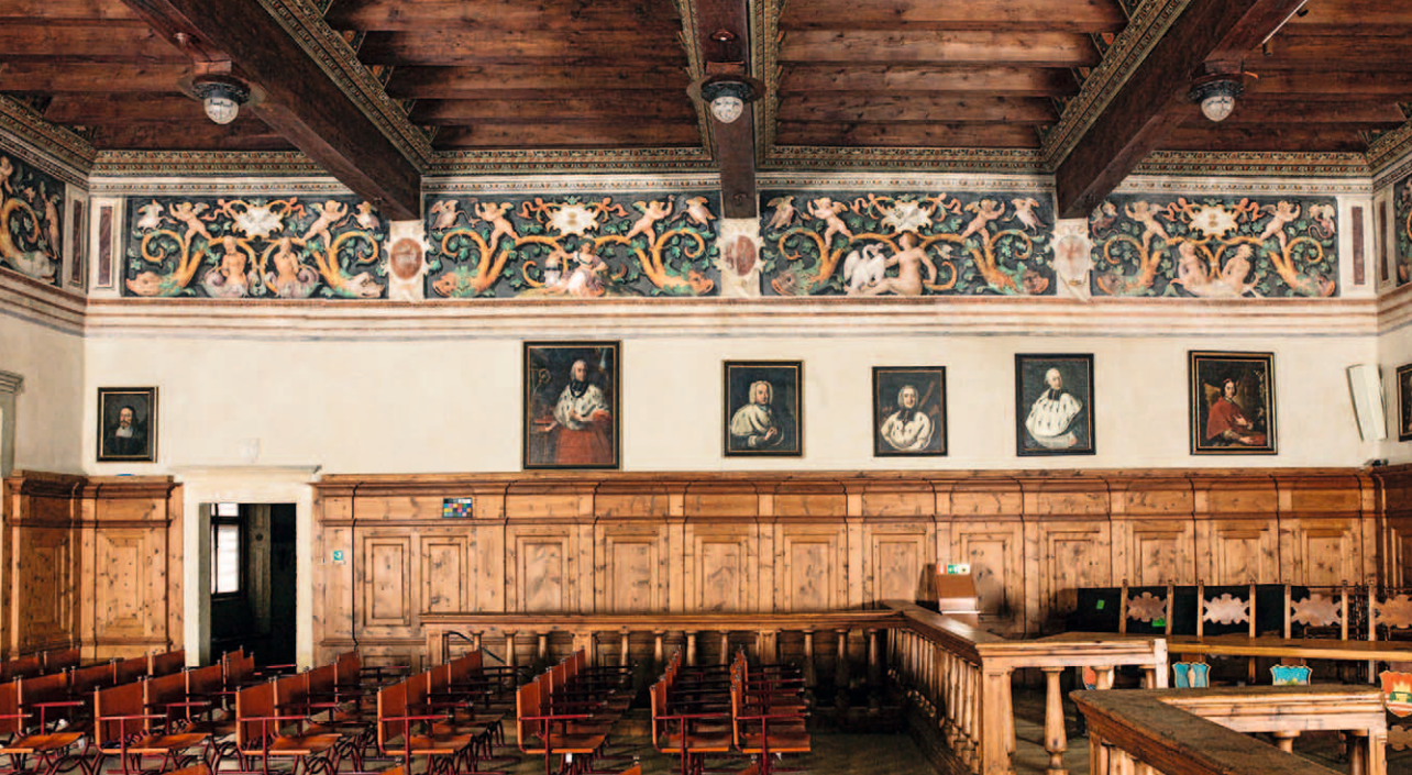
■ 3. Cavalese (Trento), Palazzo della Magnifica Comunità: Salone clesiano, fregio della parete sud

soffitto a riquadri ove compare lo stemma del principe vescovo Bernardo Cles (1514-1539), costituito dalle sette verghe raccolte in fascio e corone d'oro, talora accompagnate da angeli musicanti. La seconda è adorna di un soffitto a travi intagliati con i simboli clesiani e presenta pareti di gusto classicheggiante scandite da eleganti lesene con capitello e cornice, sopra la quale si snoda una fascia monocroma con putti, uccelli ed elementi decorativi floreali: un motivo d'ornato che appare pressoché invariato negli affreschi fogoliniani di Egna.