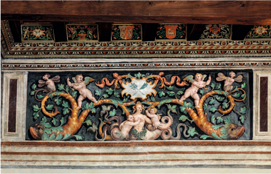
■ 14. Marcello Fogolino e collaboratori, Allegoria della Carità , 1539-1540, affresco. Cavalese (Trento), Palazzo della Magnifica Comunità, Salone clesiano, parete ovest

con il braccio sinistro cinge un secondo nato di sesso maschile con due poderose code. La seducente sirena, con i capelli acconciati a code svolazzanti, porta celate le nudità intime da una ghirlanda di foglie 40 .