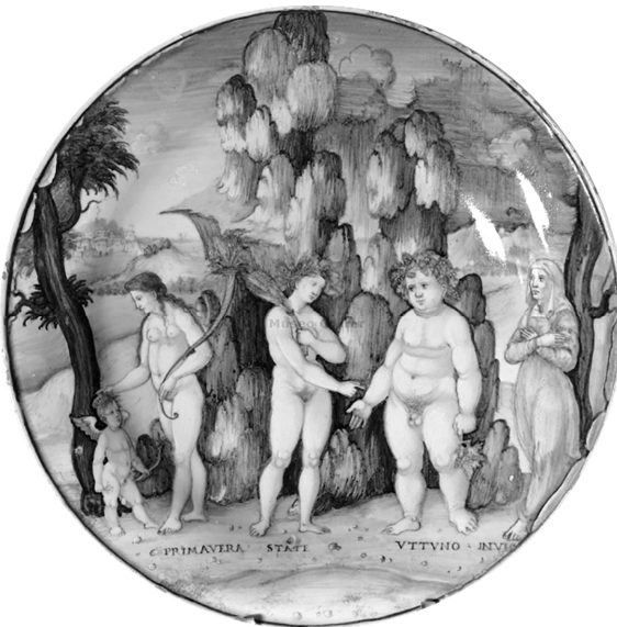
Abb. 6: Nicola da Urbino, Teller istoriato mit den Allegorien der vier Jahreszeiten, Maiolika, um 1525. Venedig, Museo Correr, Cl. IV n. 0003.

It Ver et Venus, et Veneris praeununtius ante pennatus graditur, Zephyri vestigia propter Flora quibus mater praespargens ante viai cuncta coloribus egregiis et odoribus opplet. inde loci sequitur calor aridus et comes una pulverulenta Ceres et etesia flabra aquilonum. inde Autumnus adit, graditur simul Euhius Evan. inde aliae tempestates ventique secuntur, altitonans Volturnus et auster fulmine pollens. tandem bruma nives adfert pigrumque rigorem reddit; Hiemps sequitur crepitans hanc dentibus algu. 44