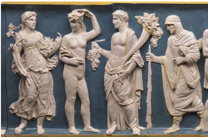
Abb. 1: Bertoldo di Giovanni und Werkstatt (zugeshr.), Das Schicksal der Seele , Detail: Allegorien der vier Jahreszeiten , glasierte Terrakotta, um 1490. Poggio a Caiano (Prato), Villa Medicea , Sala del Fregio .

Dafür wird man allerdings noch ein Jahrhundert warten müssen: Während im 14. und 15. Jahrhundert die weit verbreiteten Darstellungen der Monatszyklen im Gefolge der reichen mittelalterlichen Tradition auch in Freskenzyklen umgesetzt wurden (wie beispielsweise in der Torre Aquila des Castello del Buonconsiglio in Trient, im Palazzo della Ragione in Padua und im Palazzo Schifanoia in Ferrara), scheinen Darstellungen der Jahreszeiten, von Lorenzettis Allegorien abgesehen, keinen Platz zu finden. Erst am Ende des Quattrocento tauchen die ersten Darstellungen auf. Doch aufgrund der bereits besprochenen Seltenheit mittelalterlicher Darstellungen war es nun notwendig, im Vergleich zu anderen „etablierten“ Allegorien (wie Monate, Laster und Tugenden usw.), die stagioni ganz „neu“ zu entwerfen. Auf diese Herausforderung reagierten Künstler und Werkstätten ganz individuell, indem sie auf jeweils unterschiedliche literarische und figurative Vorbilder sowie auf das eigene Repertoire zurückgriffen. Gerade aus diesen Gründen scheint die erste Darstellung, die ich orten konnte, die Allegorien der vier Jahreszeiten im glasierten Terrakotta-Fries, den Lorenzo de' Medici für das Giebelfeld der Fassade der Villa in Poggio a Caiano (ca. 1490) in Auftrag gab, von großem Interesse. Für den Entwurf des Frieses war der ältere Bertoldo di Giovanni (ca. 1440–1491) zuständig, auch wenn bis zu fünf verschiedene Künstler an dessen Realisierung beteiligt waren. 20