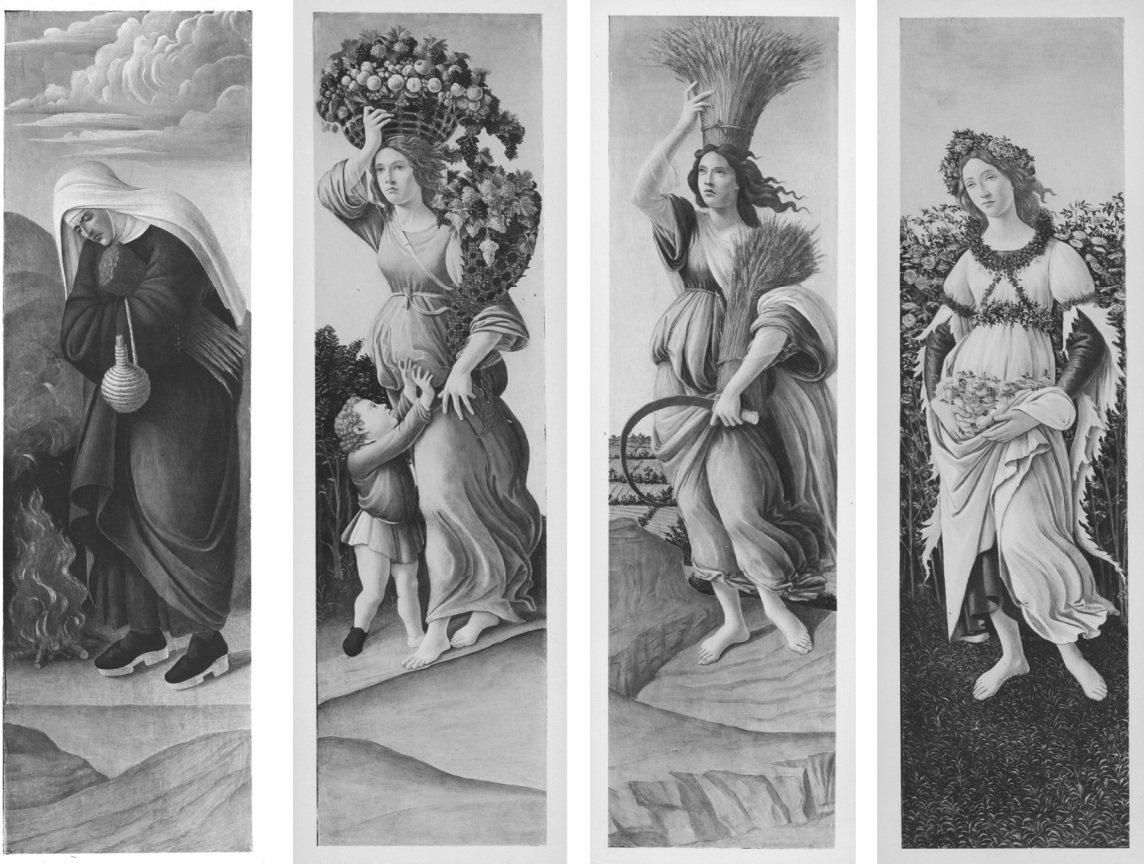
Abb. 2: Sandro Botticelli (Werkstatt) (zugeschr.), Allegorien der vier Jahreszeiten: Frühling, Sommer, Herbst und Winter, Öl auf Holz, nach 1510. Unbekannter Aufbewahrungsort.

auf, als unberechenbare, teils positive, teils negative Kräfte wahrgenommen zu werden, wie noch im Palazzo Pubblico in Siena. Stattdessen traten sie in ein idealisiertes Reich pastoraler Übernatürlichkeit ein, von dem aus sie harmonisch in ihrem vollkommenen und notwendigen Kreislauf den Lebensrhythmus des Menschen leiten, der nun nicht mehr von der Arbeit ermüdet und zu ihr verdamm t, sondern durch sie gedelt und bestimmt ist.