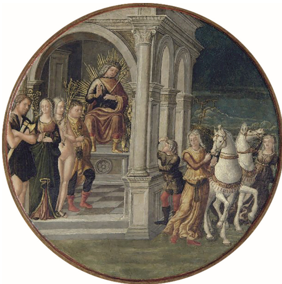
Abb. 4: Maestro del Fetonte Correr (zugeschr.), Apollo erlaubt Phaeton, den Sonnenwagen zu fahren . Tempera und Öl auf Holz, ca. 1495–1500. Venedig, Museo Correr, Cl. I n. 0559.

finden. Zur Serie gehört höchstwahrscheinlich auch eine Allegorie der Zeit (The Mary and Bernard Berenson Collection, I Tatti), die einen alten Mann mit langem Bart und Krücken zeigt, der einem kleinen Kind eine Sanduhr weist. Sie symbolisiert das unaufhaltsame Vergehen der Zeit, dem nicht einmal das Kind entkommen kann. 37 Der bereits in der Antike verbreitete Topos der „schädlichen Macht der Zeit“ wurde von Ovid ( Met XV , 234 f.) genauso wie von Horaz ( Od IV , 7) betont. Mit der Mediation von Petrarca's Werk, vor allem seinen Trionfi (die ab der ersten gedruckten Ausgabe 1470 außerordentlich populär wurden) und dem Canzoniere , bekam das Motiv des Vergehens der Zeit erneute Aufmerksamkeit. Die wieder in den Mittelpunkt gerückte Frage ihres nicht aufzuhaltenden Verfließens scheint mir eine zusätzliche, zentrale Voraussetzung für die