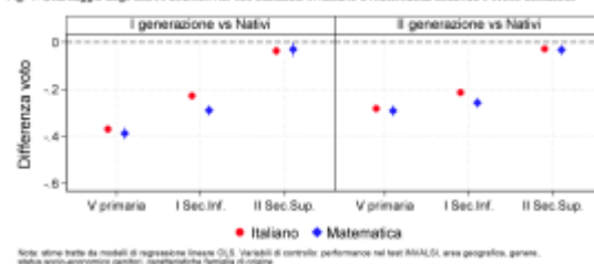
Fig. 1: Svantaggio degli alunni stranieri nei voti scolastici in italiano e matematica secondo il livello scolastico

Nota: stime tratte da modelli di regressione lineare OLS. Variabili di controllo: performance nei test INVALSI, area geografica, genere, status socio-economico genitori, caratteristiche famiglia di origine.