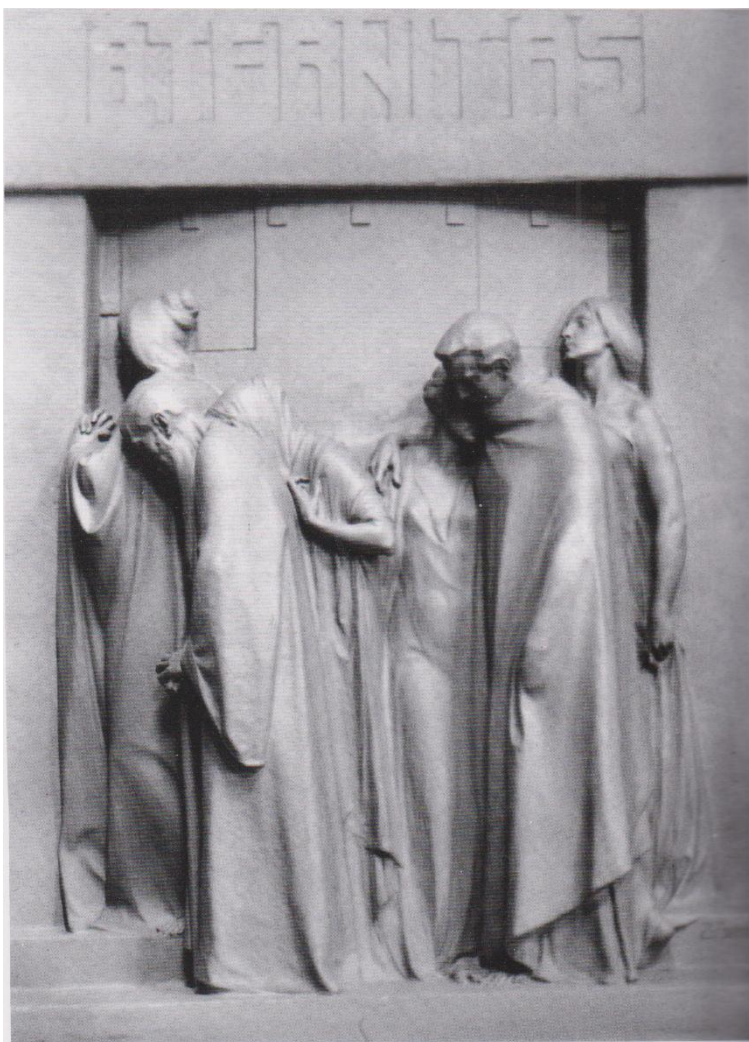
Fig. 4: Stefano Zuech, Aeternitas , 1911, gesso patinato, Famedio, Cimitero monumentale di Trento