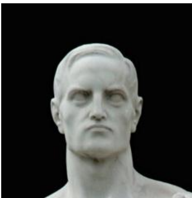
Fig. 5: Dettaglio del volto del Monumento al minatore di Stefano Zuech