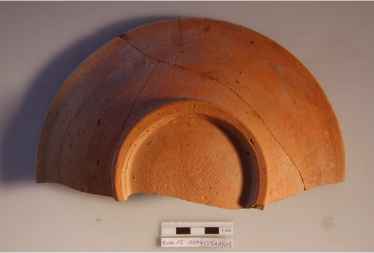
Figura 4 Efeso, quartiere tardo-antico e medievale: frammento di piatto con nota di possesso (inv. EVH 12 1074/2511).

nufatti ceramici che hanno sempre assolto alla loro originaria funzione - materiali che d'ora in avanti verranno individuati con l'espressione di 'iscrizioni su ceramica'. Le iscrizioni su ceramica sembrano riportare note di possesso o notazioni commerciali (generalmente in greco, almeno in un caso in latino), tipologie di testi per le quali si dispone di ampia evidenza testimoniale in ogni angolo del Mediterraneo e che, del resto, rappresentano - sotto la denominazione di inscribed economy - una fonte primaria per lo studio dell'economia antica. 12 Non è un caso che i nuovi materiali provengano da differenti tipi di vasellame (fra cui anfore) e di ceramica da cucina, di cui si può prendere ad esempio il piatto con nota di possesso di un certo Teofane [fig. 4].