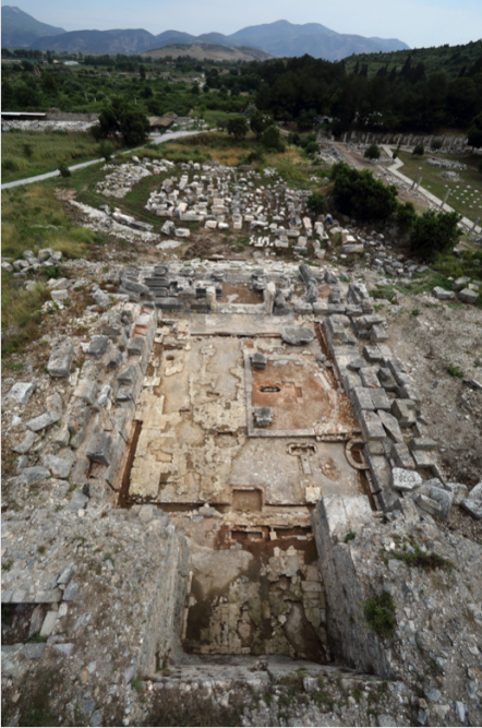
Figura 1 Efeso, Serapeo: la cella ripresa dall'alto. (© ÖAW-ÖAI/N. Gail)

mente riportati alla luce: si tratta di un patrimonio epigrafico di testi informali (opposti per loro stessa natura alle iscrizioni monumentali, indirizzate ad un pubblico più ampio) il cui apporto, pur generalmente trascurato e ancora in attesa di un esame approfondito, è in grado di offrire uno spaccato sulle caratteristiche della cultura scrittoria locale.