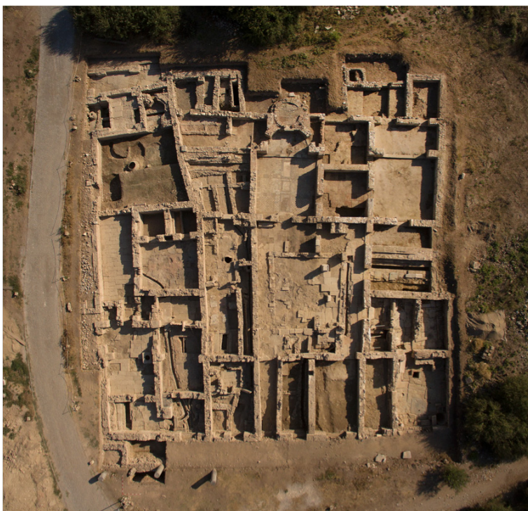
Figura 2 Efeso, Serapeo: foto aerea della scalinata d'accesso. In alto, sulla sinistra, è visibile il sondaggio da cui proviene uno dei due gruppi di ostraka.