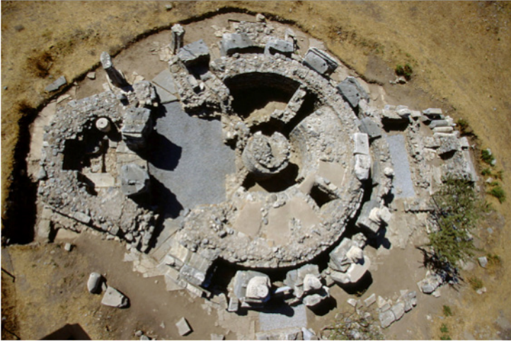
Figura 5 Efeso, c.d. Sepolcro di Luca: immagine aerea.

Pülz, 13 il Sepolcro di Luca era in origine una fontana che, costruita alla metà del II secolo d.C., venne riconvertita in età tardo-antica (probabilmente nel V secolo) in edificio di culto, dotato di cripta e chiesa su podio. Gli ostraka rinvenuti sul sito [fig. 5] – i cui scavi non hanno restituito iscrizioni su ceramica – appartengono presumibilmente alla fase di rifunzionalizzazione dell’edificio in età tardo-antica. Questa circostanza, unitamente alle caratteristiche paleografiche dei reperti, ha suggerito ad Hans Taeuber, primo editore dei frammenti, una loro datazione al IV-V secolo. 14