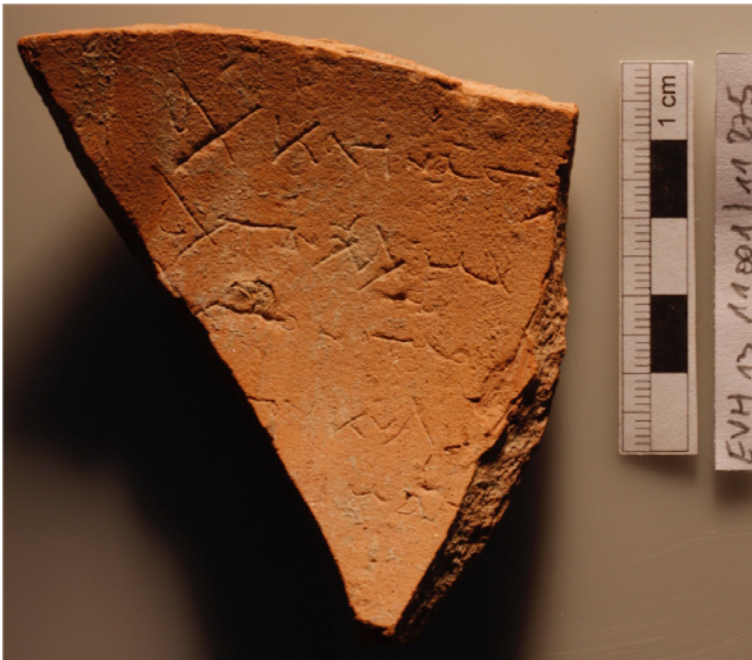
Figura 10 Efeso, frammento di ostrakon con lista (inv. EVH 13 11001/11275).

tico, dove - in analogia con analoghi documenti egiziani 43 - singoli elementi di una nota di conto sono introdotti dalla preposizione abbreviata δ(ιό). Peraltro, a proposito dell' ostrakon efesino, è certo da rimarcare come a l. 3 di questa stessa nota si faccia riferimento con ogni probabilità alla figura di un νοτάριος (νοταρί[ου ? ---]) [fig. 10].