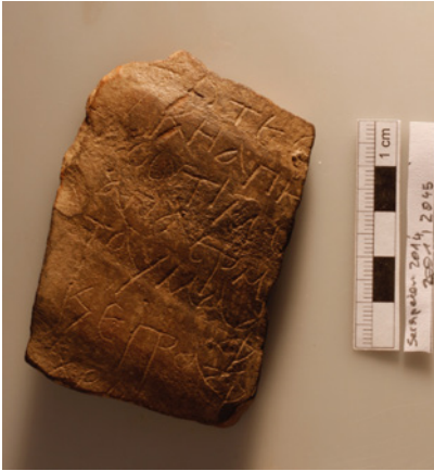
Figura 7 Efeso, Serapeo: frammento di ostrakon con cristogramma (inv. ESP 2014 2001/2045).

rispetto nei confronti di vescovi e ministri di culto. 20 In Asia Minore, tuttavia, il termine non sembra trovare confronti come appellativo onorifico conferito ai membri della gerarchia ecclesiastica. L'uso di ὄπια, d'altro canto, è ben in linea con il contesto di rinvenimento degli ostraka del Serapeo, recuperati - in effetti - nell'area di accesso alla chiesa eretta in loco alla fine del IV o all'inizio del V secolo. Una testimonianza appartenente a questo stesso gruppo suggerisce la possibile presenza di un più ampio complesso ecclesiastico: un ostrakon , infatti, reca il termine σύστημα, che nel greco patristico si riferisce talvolta ad una comunità ecclesiale, formata in special modo da monaci o da monache [fig. 8]. 21