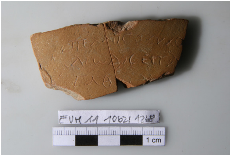
Figura 6 Efeso, quartiere tardo-antico e medievale: frammento di ostrakon con ordine di pagamento (inv. EVH 11 10621/1268).

ordini di pagamento. In proposito, infatti, Taeuber conclude: «Insgesamt scheint es sich um Reste des Archivs eines privaten Haushalts oder einer kirchlichen Verwaltung zu handeln, über deren Charakter die Evidenz keine näheren Aussagen zulässt». 19