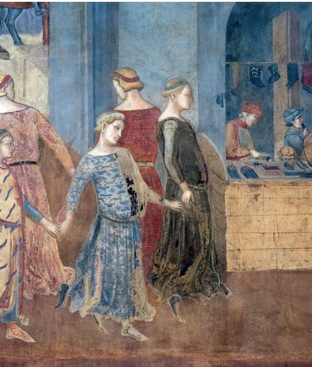
Ballo tondo con figurazione «a ponte», particolare del ciclo affrescato Allegoria ed Effetti del Buono e Cattivo Governo , realizzato da Ambrogio Lorenzetti e dalla sua bottega nel Palazzo Pubblico di Siena, tra il 1338 e il 1339.

ammalati, dei carcerati, dei pellegrini, esercitando la carità cristiana attraverso opere concrete e spesso istituzionalizzate come ospedali, ricoveri e luoghi di accoglienza. Quelle dei Disciplinati, di orientamento penitenziale, coltivavano la pratica dell'autoflagellazione come gesto di espiazione collettiva, spesso nell'ambito di processioni cantate che attraversavano le città alla stregua di vere e proprie liturgie di strada. Quelle dei Laudesi, eredi più dirette dell'esperienza dei «giullari