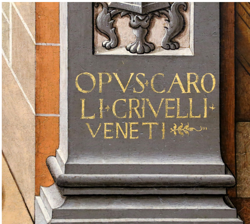
Fig. 4. Carlo Crivelli, L'Annunciazione con sant'Emidio (dettaglio con la firma)