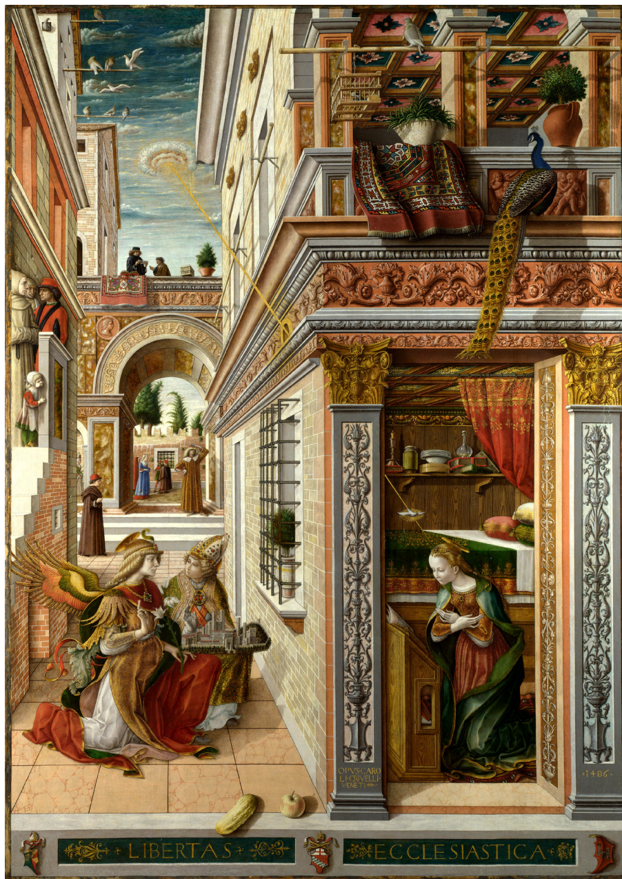
Fig. 1. Carlo Crivelli, L'Annunciazione con sant'Emidio ( Annunciazione di Ascoli ), 1486, tempera e olio su tela (trasportata da tavola), 207×146,7 cm, Londra, National Gallery