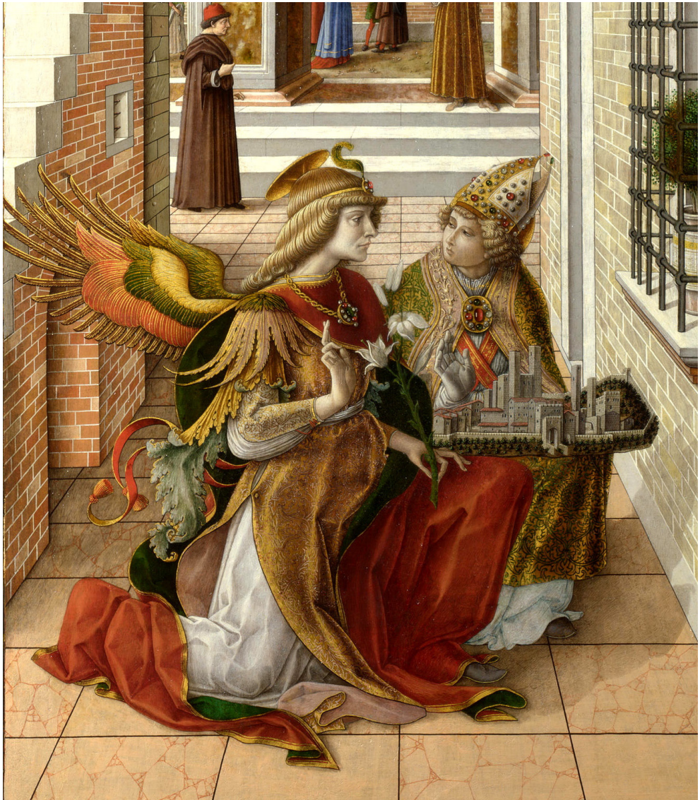
Fig. 3. Carlo Crivelli, L'Annunciazione con sant'Emidio (dettaglio con la figura dell'Arcangelo)