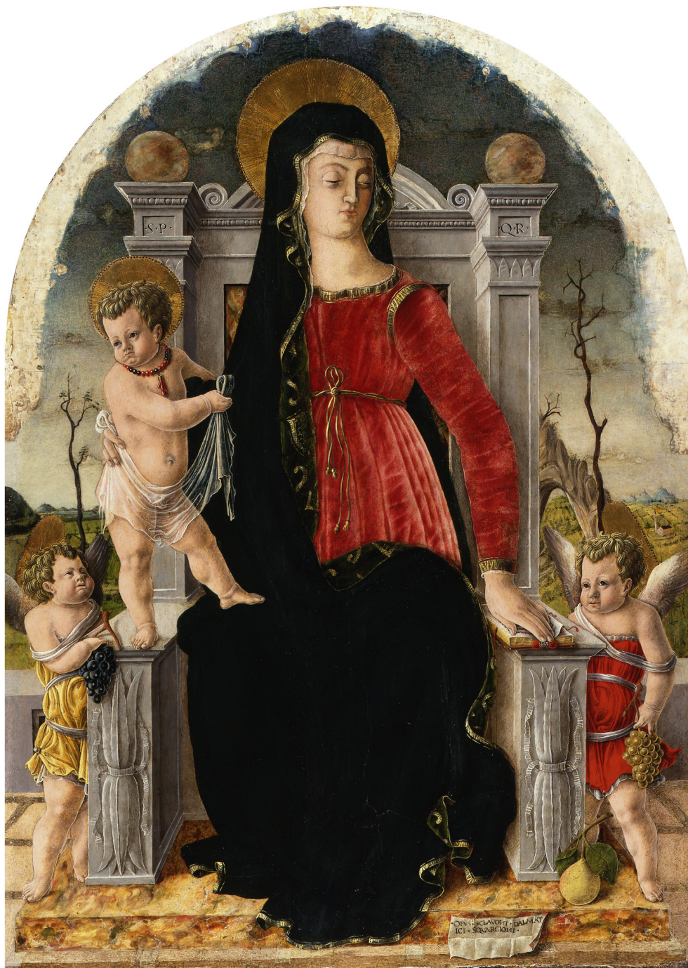
Fig. 5. Juraj Čulinović (Giorgio Schiavone), Madonna in trono con il Bambino e due Angeli , tempera su tela (trasportata da tavola), 86,5x60 cm, Berlino, Gemäldegalerie – Staatliche Museen zu Berlin