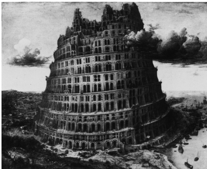
Fig. 2: Pieter Bruegel, Piccola Torre di Babele , Museum Boijmans Van Beuningen, Rotterdam

Il rapporto tra torre e città sembra ulteriormente compromesso nel secondo dipinto, la Piccola Torre di Babele (Fig. 2). A un primo sguardo l'aspetto che colpisce di più, in confronto con l'opera precedente, è proprio la mancanza di un contesto urbano: la torre sorge ancora vicino a un porto trafficato di navi, ma è circondata da un ambiente selvatico, naturale, quasi bucolico – si intravedono solo alberi, ruscelli e campi verdi. E la torre medesima è configurata diversamente: non solo risulta più imponente in proporzione al paesaggio circostante; adesso anche la sua base è del tutto artificiale. Questa torre è stata costruita da zero – e la sua stessa fondazione precede necessariamente l'eventuale costituzione di una città da lei dipendente. In altri termini, la torre emerge dalla natura circostante come un'isola sperduta spunterebbe dal mare. È lei l'unica protagonista del quadro: evidenza confermata dal fatto che gli uomini impegnati nella sua costruzione – così presenti e riconoscibili nel quadro del 1563 – sono ora talmente mi-